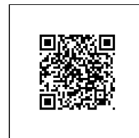
Zažádejte o vytyčení